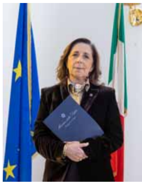
Isabella Rauti, sottosegretario di Stato alla Difesa

«Per garantire sovranità, vantaggio competitivo e strategico dobbiamo continuare a sviluppare le nuove tecnologie; governare l'intelligenza artificiale, utilizzare il quantum computing e la sensoristica avanzata, secondo un modello di difesa integrato e completo che coinvolga le industrie, le università, la società civile e il sistema Italia. In questo quadro, l'integrazione tra pubblico e privato e tra dimensione nazionale ed europea diventa determinante per sostenere l'innovazione e accrescere la resilienza industriale. La Difesa perciò deve continuare a muoversi in un'ottica di responsabilità nazionale: favorendo le relazioni industriali; abbattendo la lentezza procedurale cui ci vincola la burocrazia; investendo in cyberdifesa; in tecnologie dual-use; nella new space economy- decisiva per la sicurezza delle infrastrutture critiche e la resilienza delle reti al pari della blue economy, sempre più centrale per la sicurezza delle rotte, la protezione delle infrastrutture sottomarine e la continuità energetica. Si tratta di due ambiti complementari che contribuiscono in modo crescente alla proiezione strategica e industriale dell'Italia». • CG