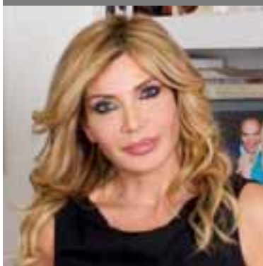
Vittoriana Abate, giornalista, autrice e conduttrice televisiva

«Non chiamatelo amore: se ti insulta, ti controlla, ti umilia o ti fa del male, non è amore. È violenza». Queste parole di Vittoriana Abate, giornalista, conduttrice e autrice che ha dedicato molta della sua ricerca e del suo lavoro all'analisi dei casi di violenza di genere, non sono solo un monito, ma un invito a guardare la realtà con chiarezza e consapevolezza. Attraverso libri, programmi televisivi e approfondimenti, Vittoriana Abate si è confrontata con storie di donne vittime di femminicidio, cercando di dare voce alle loro esperienze e di sensibilizzare l'opinione pubblica su un fenomeno drammatico.