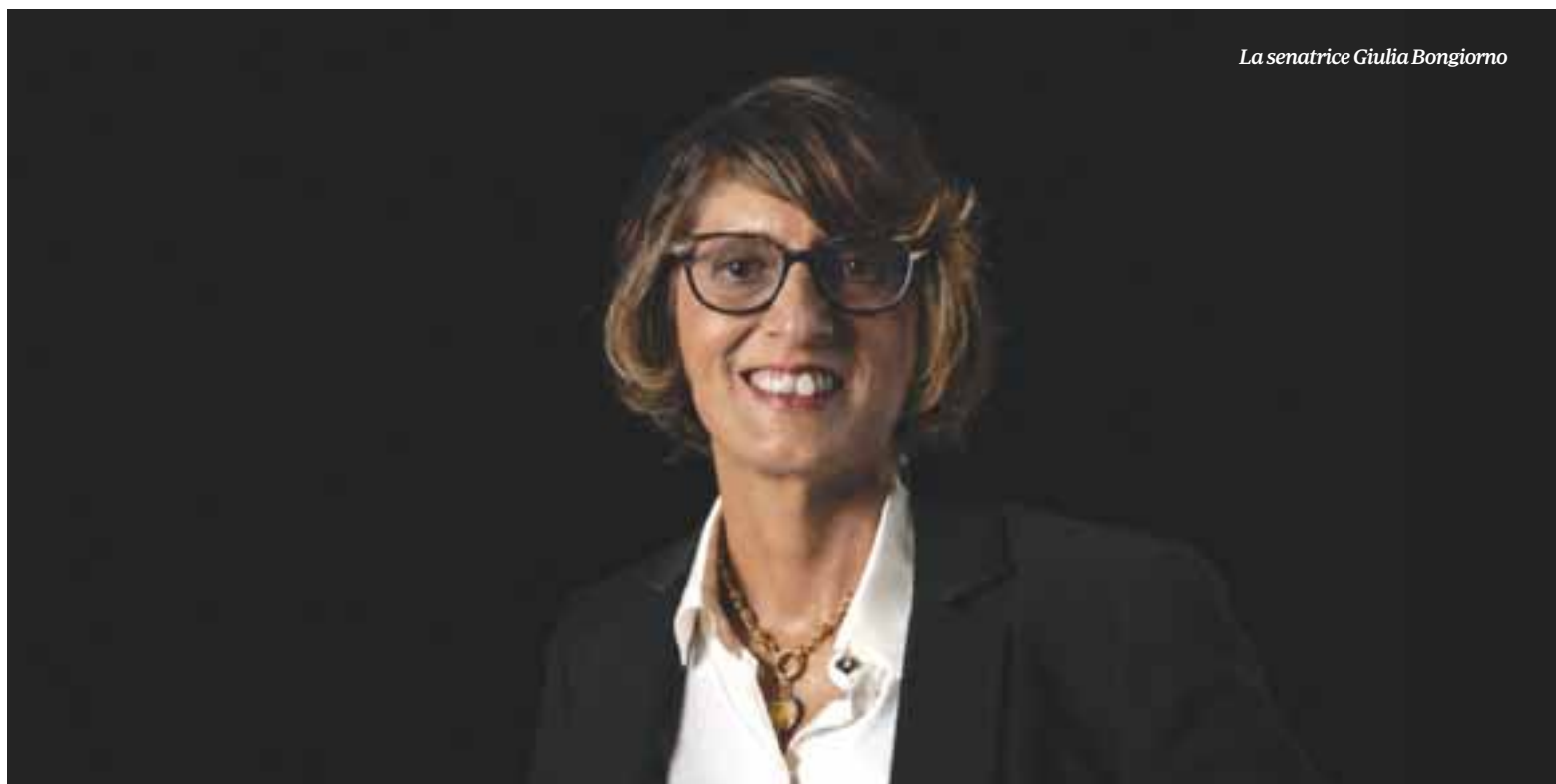
La senatrice Giulia Bongiorno

L'avvocato Giada Bocellari definisce la condanna di Alberto Stasi come un'ingiustizia processuale